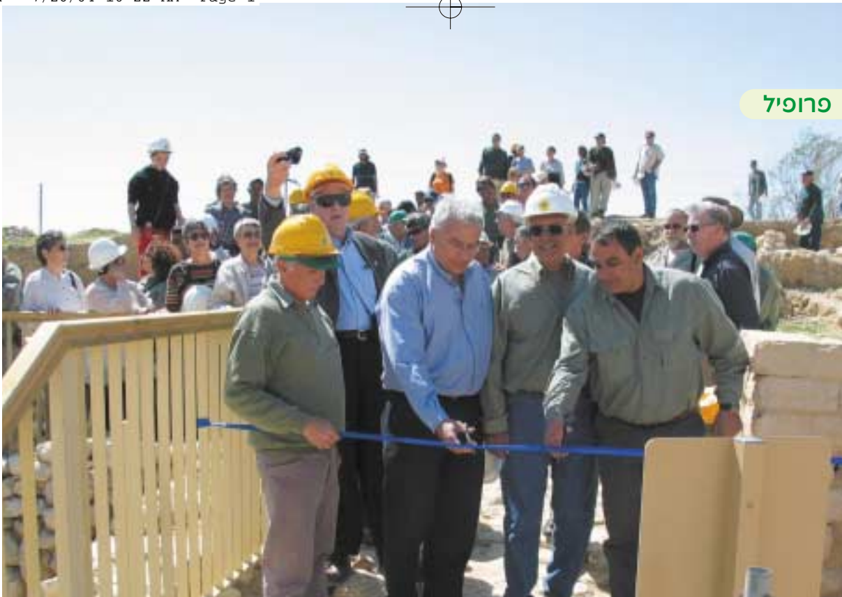
טקס חנוכת מפעל המים הקדום בתל באר שבע