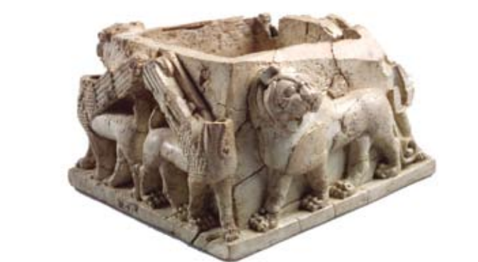
קופסת שנהב מעוטרת בספינקיים

3. הארמון הכנעני – מעבר לשער הכנעני, מצד ימין, ניצב קיר אבן גדול, שעוביו כשני מטרים, שרידי בודד בשטח מארמון השליט של