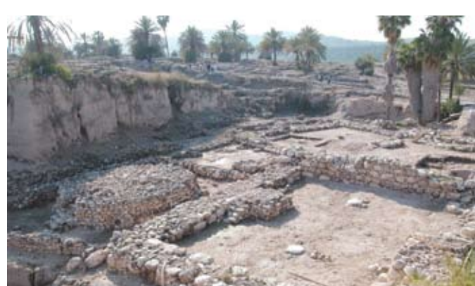
אזור המקדשים ובמת הפולחן מתקופת הברונזה הקדומה

הגן הלאומי מגידו הוכרז בשנת 1966 והוא משתרע על שטח של 190 דונם. בשנת 2005 הוכרז תל מגידו על-ידי אונסקו, יחד עם התלים המקראיים חצור ובאר שבע, כאתר מורשת עולמית.