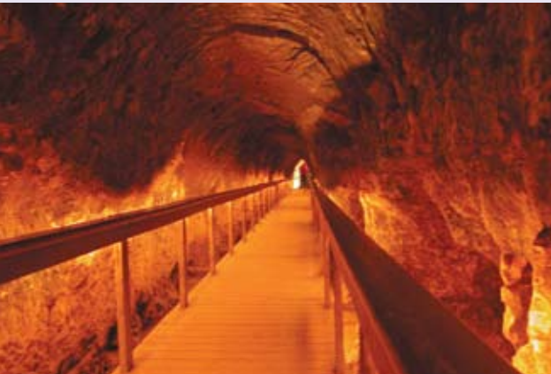
המנהרה האופקית של מפעל המים