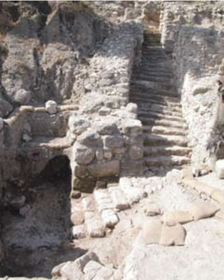
מאגר המים בכניסה לתל מגידו, מהתקופה הישראלית 2

1. מאגר מים – גרם המדרגות המרשים שלפנינו יורד מכיוון מעבר שער העיר של התקופה הישראלית (מס' 4) אל בריכה מטויחת שנועדה לאגירת מים. עדיין לא התברר מה היה מקור המים.