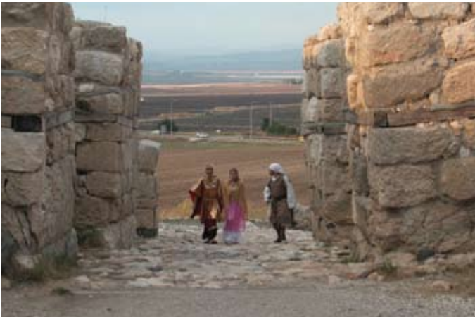
שער מגידו מהתקופה הכנענית המאוחרת

6. הארוות הצפוניות – במגידו נתגלו שני מכלולי ארוות – האחד בצפון-מזרח התל והשני בדרום-מערב – המעידים כי מגידו של אותה תקופה הייתה לעיר שתפקידה המרכזי אחזקת יחידות צבא של רכב ופרישים או שחר סוסים. בניית עיר הארוות מיוחסת