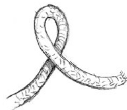
שלב 1 -

עם הקצה הקצר יוצרים לולאה נוספת גדולה יותר ומשחילים את הקצה דרך הלולאה הקטנה מלמטה.