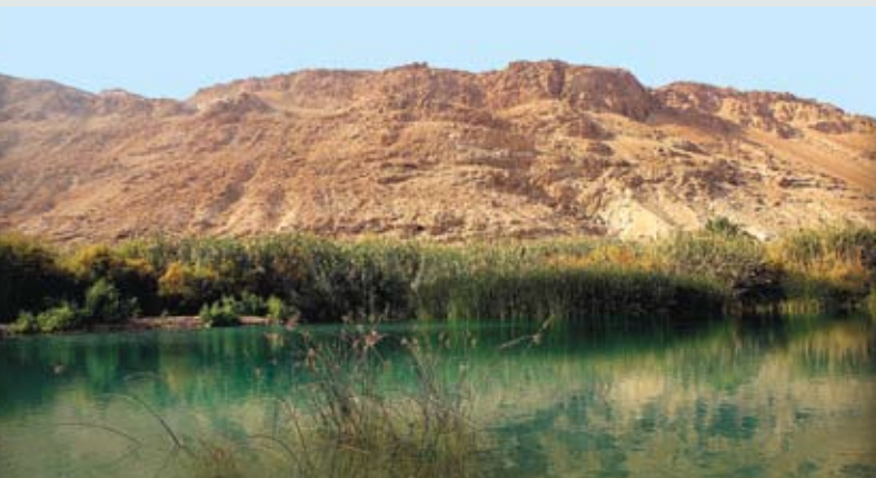
שיקום בית הגידול הלח שמורת עיינות צוקים

במהלך העשור האחרון רשות הטבע והגנים מבצעת פעולות רבות לשימור בית הגידול של הבריכות, ולכן אנו מעמיקים בריכות ותיקות וחופרים בריכות חדשות במקומות שבהם נובעים מים באופן טבעי. באופן זה מוגנות אוכלוסיות הדגים ואלהן נלווים שאר בעלי החיים והצומח בשמורה.