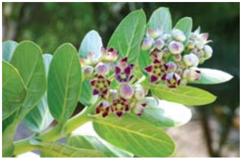
פתילת המדבר (תפוח סדום)

"וייף בגדלו באורך דליוותו כי היה שרשו אל מים רבים" (יחזקאל לא, ז)