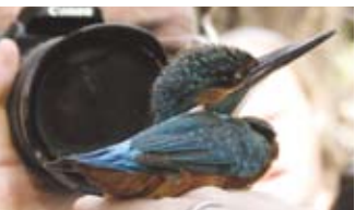
טיבוע שלדג גמד