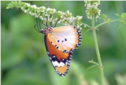
דנאית תפוח סדום

טלפון לתיאום הדרכות ולפרטים נוספים: *3639 מכל טלפון.