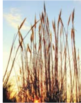
קנה סוכר מצוי

הימצאות של מים מליחים בשילוב עם טמפרטורות גבוהות במשך כל השנה מאפשרים התפתחות של צומח טרופי שמוצאו סודני, כמו שיח פתילת המדבר (תפוח סדום) – צמח טרופי-יובשני המאפיין את האזור. הוא בעל פרי בצורת תפוח, שחוכו חלול ובמרכזו זרעים דמויי נוצה ובעלי ציצית הממלאת תפקיד חשוב בהפצת הזרע על ידי הרוח.