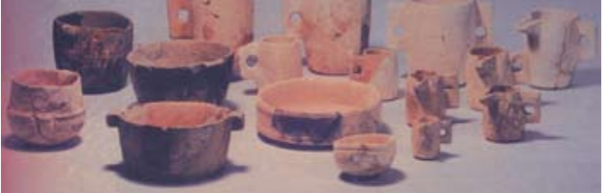
שרידים של המורדים: כלי אבן