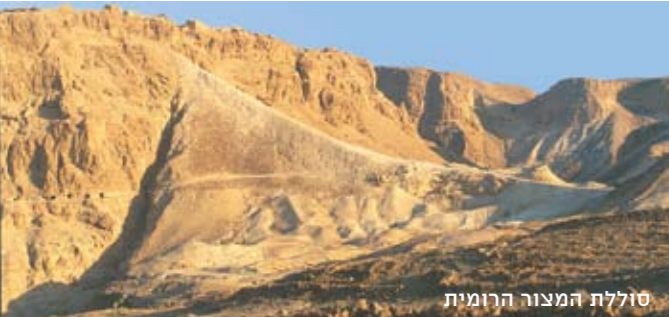
סוללת המצור הרומית

פעולות שימור ושחזור מתבצעות במצדה על-ידי רשות הטבע והגנים.