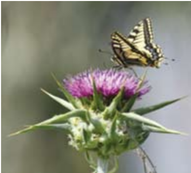
זב סנונית נאה