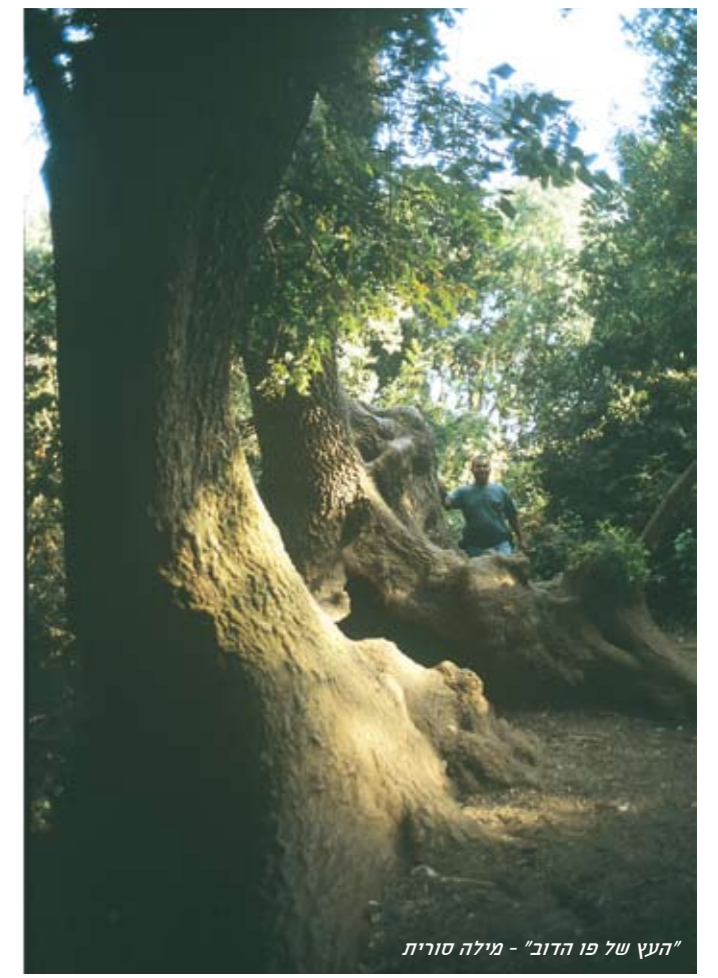
"העץ של פו הדוב" - מילה סורית