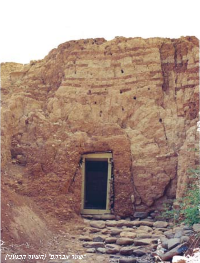
"שער אברהם" (השער הכעני)

קשה להבחין בציפורים בין סככי הענפים, אך אפשר ליהנות מקולה של ה צטייה - ציפור שיר קטנה המסתתרת ומקננת בסבך. על ה"איים" מקנן לעיתים נחליאלי לבן . בשנים האחרונות רבים ה עורבנים בשמורה.