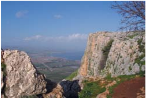
מצוק הארבל, בקעת גינוסר וצפון-מערב הכנרת