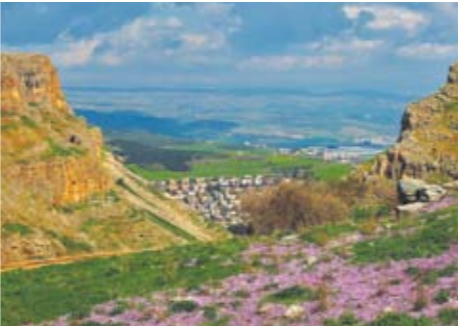
פריחה בארבל - כרמלית נאה

מצפור הר ניתאי – למצפור מוביל שביל היוצא מרחבת החניה צפונה. המצפור צופה על הר ניתאי, נחל ארבל ושרידי כפר המערות. המצפור והשביל המוביל אליו מוגנשים.