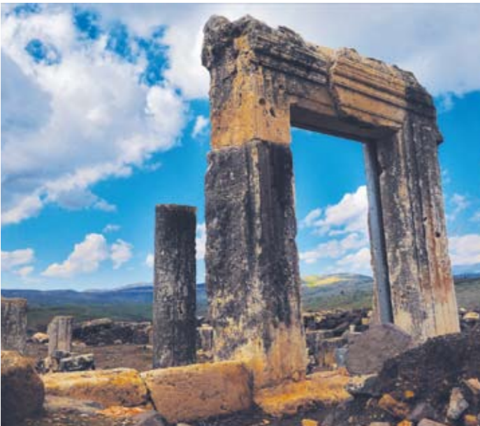
משקוף בית הכנסת בארבל

לבית הכנסת היו שתי קומות. עמודי האולם המרכזי נשאו כותרות קורינתיות, בעוד עמודי הגלריה שבקומה השנייה עוטרו בכותרות יוניות. בית הכנסת נבנה בעיקרו אבני גזית עשויות גיר ועל כן בלט מאוד על רקע בתי הבזלת שמסביבו.