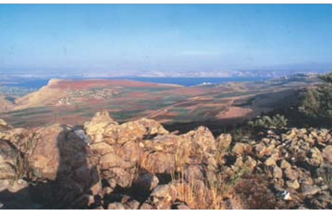
בקעת ארבל במבט מקרני חטין

מצוק סלע זקוף מתנוסס לתפארה מעל פי תהום – מול הכנרת, הגולן והחרמון; יישוב קדום שהותיר אחריו שרידי בית כנסת מפואר; שבילי טיול אל מבצר מערות המקנן בנקיקי סלע – אלה הם שמורת טבע וגן לאומי ארבל - אתר מורשת קדום שנמצא בלב פנינת טבע נופך.