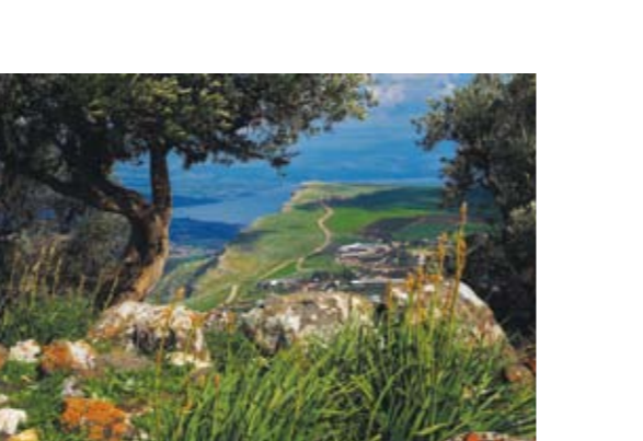
תצפית מארבל לכיוון הכנרת

כתיבה: יעקב שקולניק; עריכה: ד"ר צביקה צוק מידע על המערות: ד"ר ינון שבטיאל עריכה לשונית: נועה מוטרו; מידע על בית הכנסת: בני ארוכס מפה: שלום קוולר; הפקת המפה: יובל ארטמן כותלי - דרור גלילי; הפקה: עדי גרינבאום © רשות הטבע והגנים