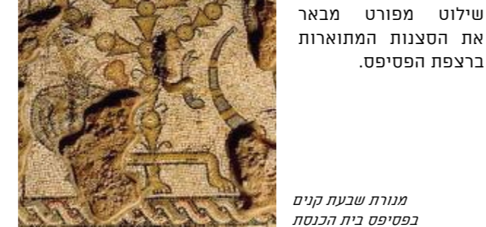
מגורת שבעת קנים

שילוט מפורט מבאר את הסצנות המתוארות ברצפת הפסיפס.