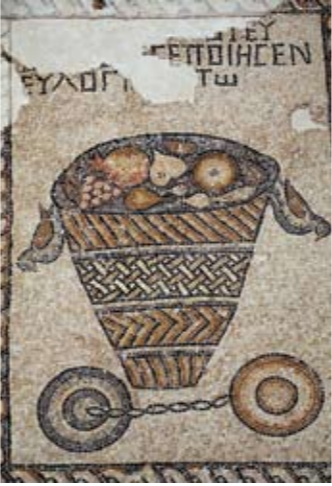
אילום: ד"ר יצחק

בית הכנסת (16) – לפי המקורות היו בציפורי בתי כנסת רבים, אך רק אחד מהם נחשף, בחפירה בשנת 1994, בצפון האתר. זהו בית כנסת שהוקם בראשית המאה ה-5 לסה"נ, והוא שכן בשכונת מגורים שנוסדה עוד בתקופה הרומית. זהו בניין ארוך וצר (15x7 מ') אשר כיוון התפילה שלו מנוגד לירושלים. חדר כניסה מלבני נמצא בחזית הבניין, וממנו נכנסים אל אולם תפילה שבו נקבע פסיפס מרהיב ביופיו, המכיל יותר מעשרים כתובות הקדשה ביוונית ובארמית. הפסיפס בסטיו הצפוני מכיל דגם גיאומטרי של עיגולים מצטלבים ואילו בחלל המרכזי שטיח פסיפס העשיר במוטיבים יהודיים ובסיפורים מקראיים הסדורים ברצועות אופקיות, המחולקות בכמה מקומות