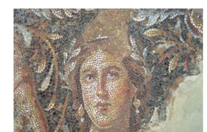
דמות האישה היפה בפסיפס בבית דיוניסוס

החפירות הראשונות באתר נערכו בשנת 1931 בידי ל' ווטרמן מאוניברסיטת מישיגן שבארצות הברית. סקר אמות המים ומחקרן החל בשנת 1975 בידי משלחת מאוניברסיטת תל אביב בניהולו של צ' צוק. המשלחת חפרה את מאגר המים העתיק (1) בשנים 1993-1994. פעולות מחקר וחפירה בציפורי חודשו בשנת 1983 בידי משלחת מאוניברסיטת טמפה בפלורידה, בהנהלת