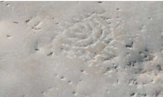
מגורת שבעת קנים חקוקה על גבי אחת ממרצפות ה"קרדרו"